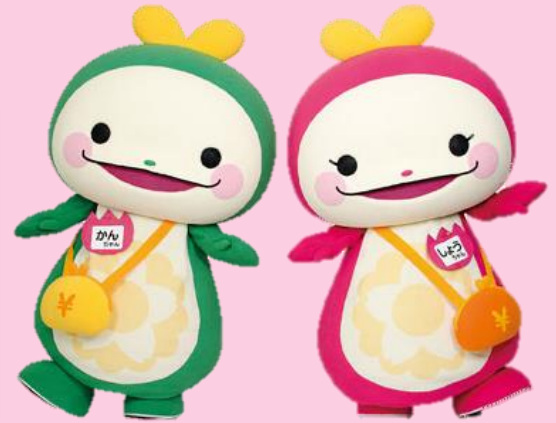
間税会のイメージキャラクター かんちゃん・しょうちゃん